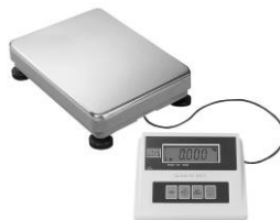
Panel sterujący na kablu, wersja stołowa / ścienna