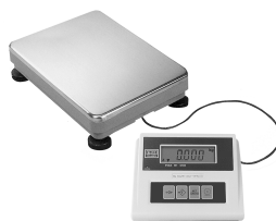
Panel sterujący na kablu, wersja stołowa / ścienna